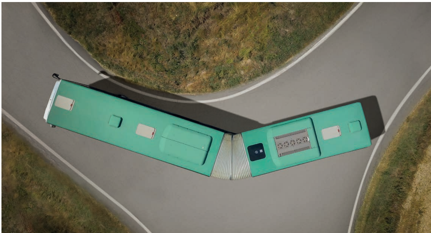
Autobus con soffietto di PEI Mobility.